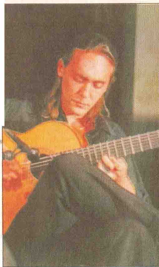
Vicente Amigo, una delle star di questa edizione di Adriatico Mediterraneo

uno dei chitarristi spagnoli di flamenco più acclamati al mondo, l'attrice francese Charlotte Rampling, consacrata regina dello schermo da Il Portiere di Notte di Liliana Cavani nel '74, che sarà protagonista dell'intenso e raffinato spettacolo «Konstantinos Kavafis e Marguerite Yourcenar. Un incontro letterario e musicale tra il poeta greco e la scrittrice francese», assieme all'attore greco Polydros Vogiatzis e con Varvara Gyra alla chitarra (2 settembre, Teatro delle Muse-Corelli, ore 21). E ancora una produzione in esclusiva per il Festival, quella di Eugenio Bennato che, il 3 settembre all'Anfiteatro (ore 21) Le carrette del mare , l'imperdibile concerto del siriano Omar Souleyman (22 agosto, ore 21, Corte della Mole) e il cantante Raiz, (21 agosto, ore 21, Corte della Mole) con un concerto dall'impronta elettronica/dance, per chiudere con Giovanni Allevi e la Form , il 4 settembre nell'area del Porto. E poi i concerti al tramonto all'Arco di Traiano, quelli del Fringe per le vie del centro, la