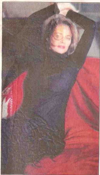
Charlotte Rampling. Accanto al titolo, Tahar Ben Jelloun